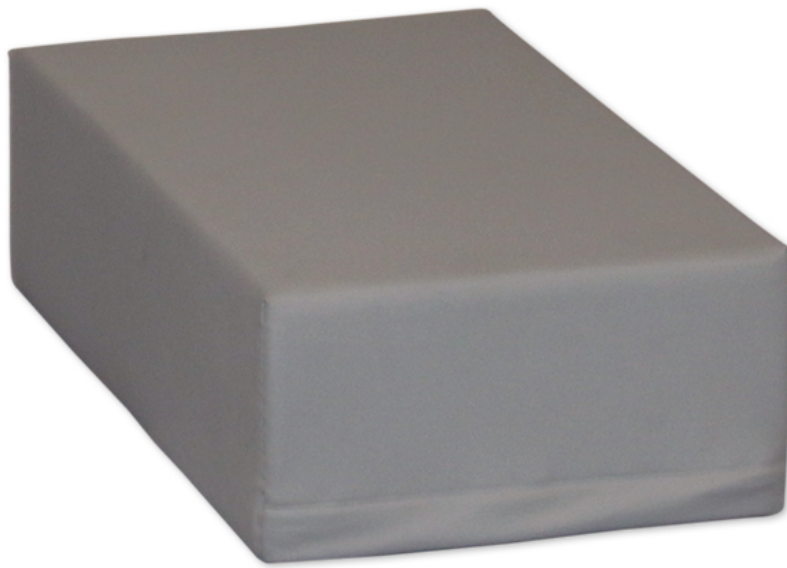
LEJRELET Pad High

Vægten udgør 800 g. Længden udgør 50 cm, bredden 30 cm og højden 15 cm.