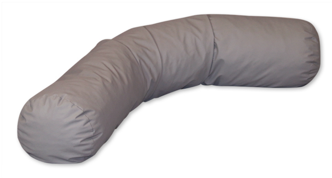
LEJRELET Tube 125

Tube 125 er dog kun halvt så lang, 125 cm, og vejer derfor kun 3 kg.