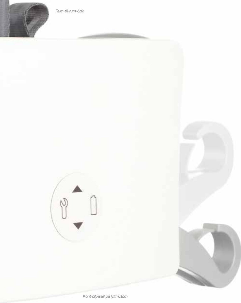
Kontrollpanel på lyftmotorn