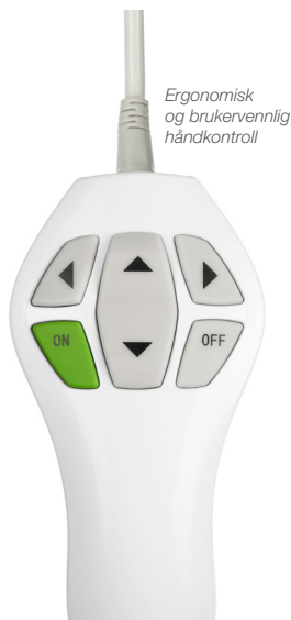
Ergonomisk og brukervennlig håndkontroll

For profesjonelle og meget funksjonelle omsorgsmiljøer med en harmonisk og menneskelig atmosfære.