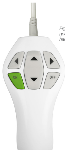
Ergonomische en gebruiksvriendelijke handbediening.

Voor professionele en zeer functionele zorgomgevingen met een harmonische en menselijke sfeer.