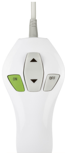
Ergonomische en gebruiksvriendelijke handbediening

Voor professionele en zeer functionele zorgomgevingen met een harmonische en menselijke sfeer.