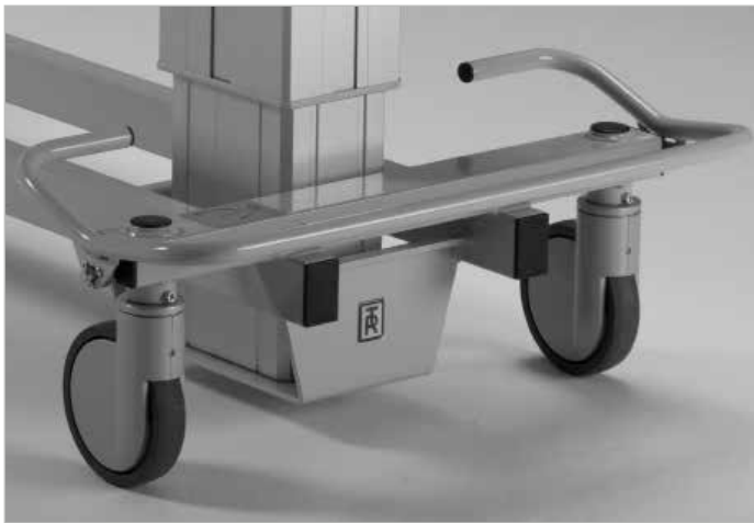
Bekvämt fotreglage för rakstyrning, transportläge och bromsning av hjul.

TR 4200 är tillverkad av varaktigt och tåligt material såsom pulverlackerat rostfritt eller elförzinkat stål som underlättar enkel rengöring och effektivt underhåll. Madrasen är löstagbar.