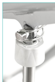
Toimilaitte irrotetaan nostovarresta pikalukitustapin avulla.

Carina350 on kokoontaitettava ja vaatii vain vähän tilaa kuljetuksen ja varastoinnin aikana. Carina350 voidaan pystyttää ja taittaa kokoon tarpeen mukaan muutamalla yksinkertaisella toimenpiteellä ja ilman työkaluja. Nostin toimitetaan kokoontaitettuna.