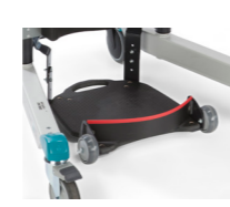
Hälband till ståplatta