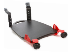
Ståplatta kort/lång, länkhjul (SW)