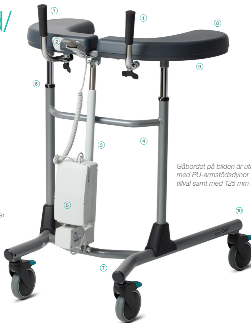
Gåbordet på bilden är utrustat med PU-armstödsdynor som tillval samt med 125 mm hjul.

Bure Standard och Bure S MANUELL är ett individuellt anpassningsbart gåbord som lämpar sig för situationer då man inte behöver ställa in det i höjdlöd särskilt ofta och inte är i behov av uppresningshjälp med hjälp av elställdonet.