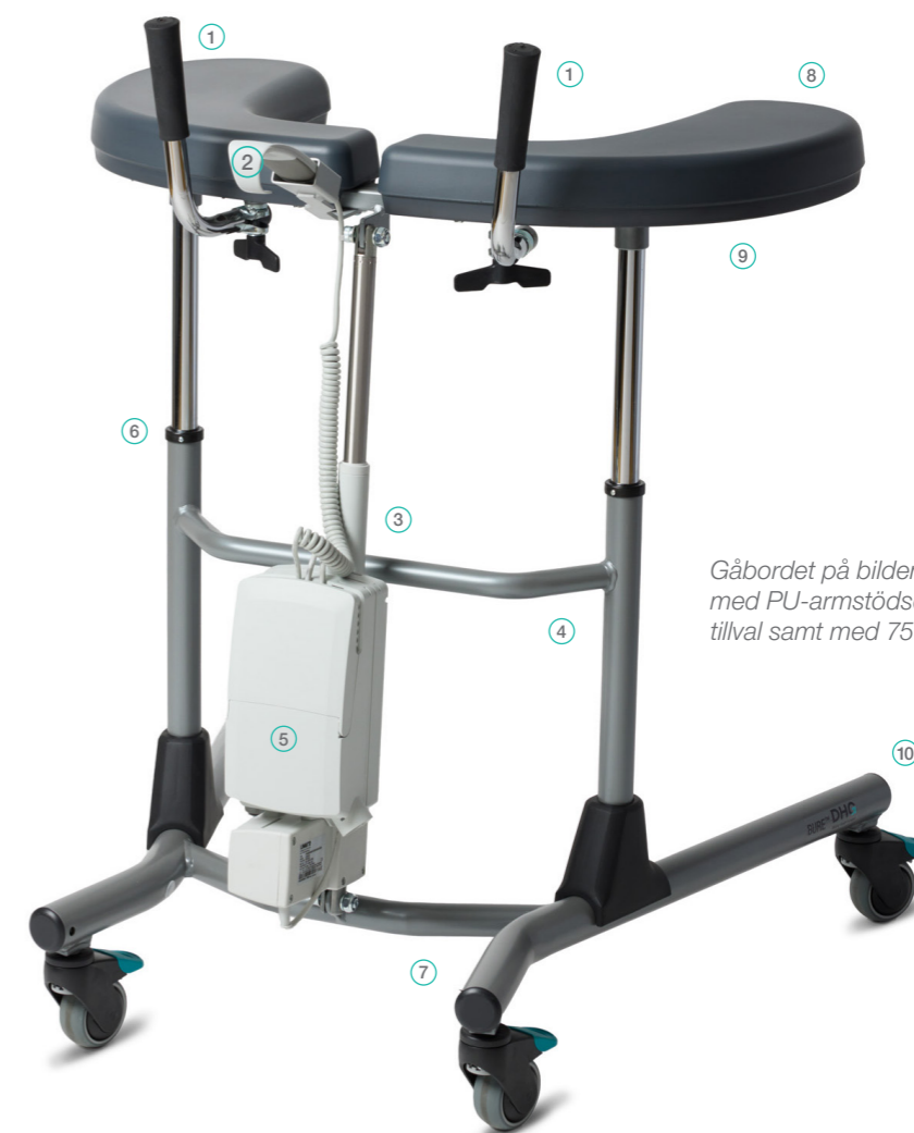
Gåbordet på bilden är utrustat med PU-armstödsdynor som tillval samt med 75 mm hjul.