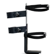
Tubhållare inkl. fäste