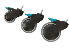
Hjul med broms 75, 100, 125mm