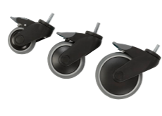
Hjul med riktningsspär 75, 100, 125mm