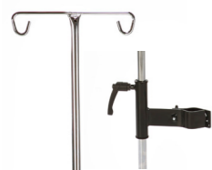
Droppställ inkl. fäste